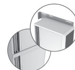
Kit d'unió SPJ-KOOL (Galv. / inox)