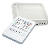
Kit Control Clever