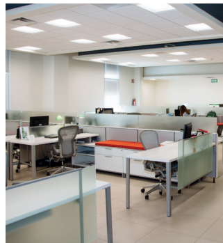
Despachos y oficinas