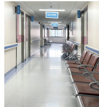
Clínicas y residencias