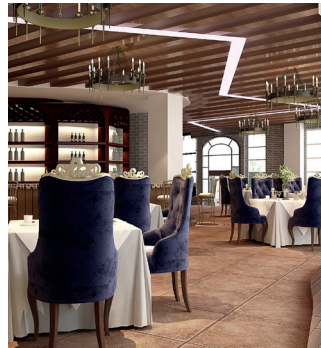
Restauración y hostelería