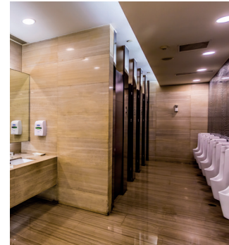
Aseos públicos y vestuarios