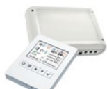
Kit Control Clever