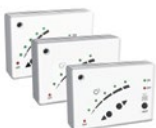
Control bàsic ✓ Inclòs