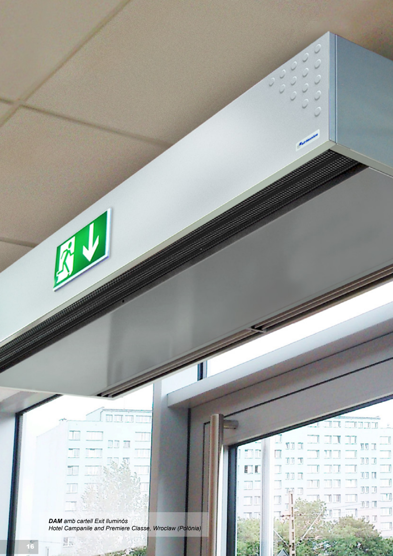
DAM amb cartell Exit lluminós Hotel Campanile and Premiere Classe, Wroclaw (Polònia)