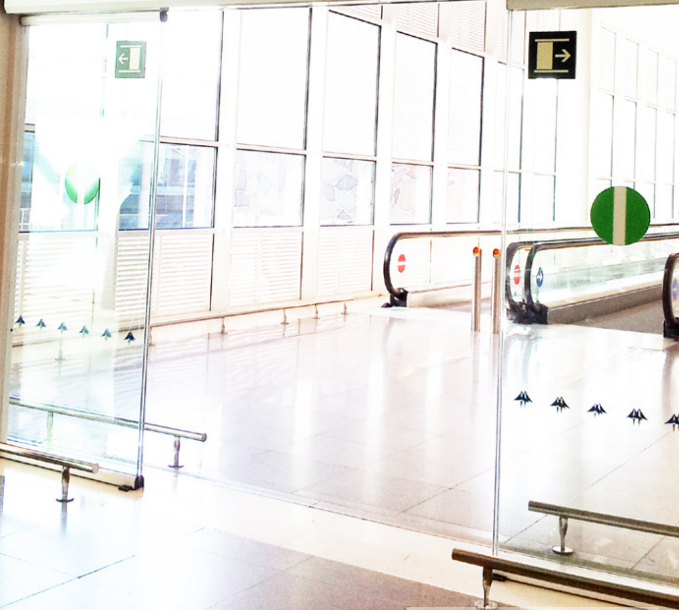
OPTIMA Aeroport El Prat, Barcelona (Espanya)