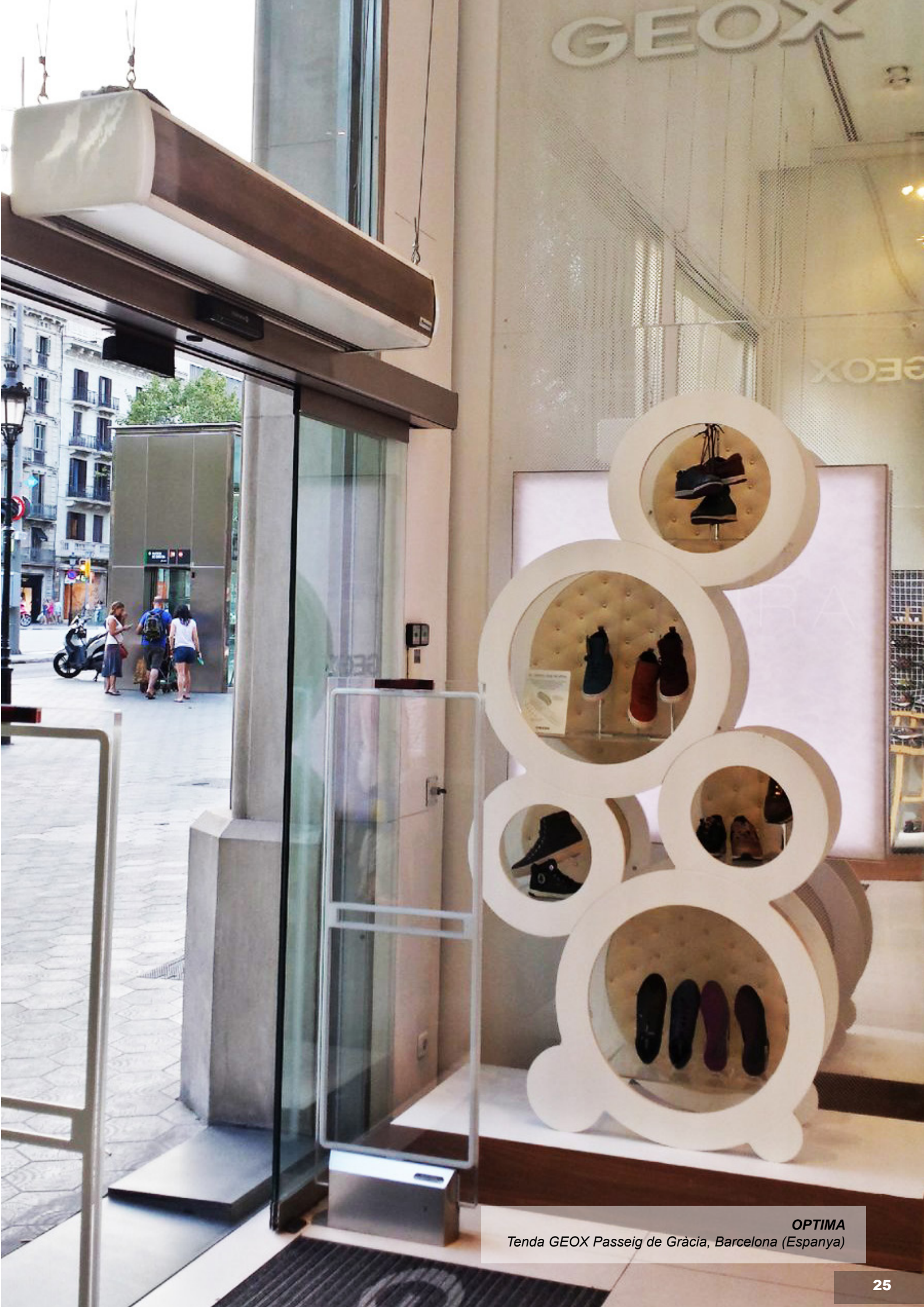
OPTIMA Tenda GEOX Passeig de Gràcia, Barcelona (Espanya)