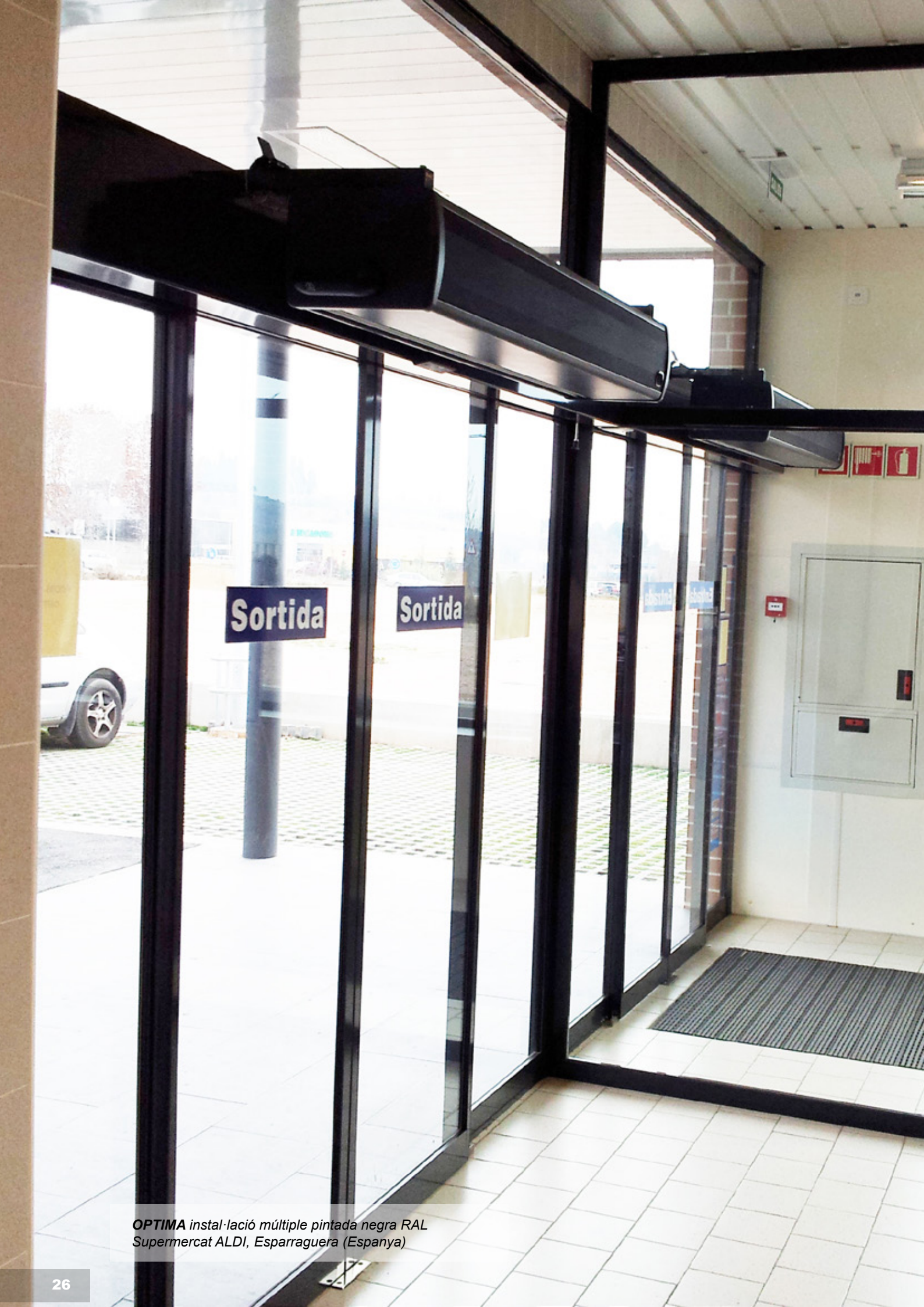
OPTIMA instal·lació múltiple pintada negra RAL Supermercat ALDI, Esparraguera (Espanya)