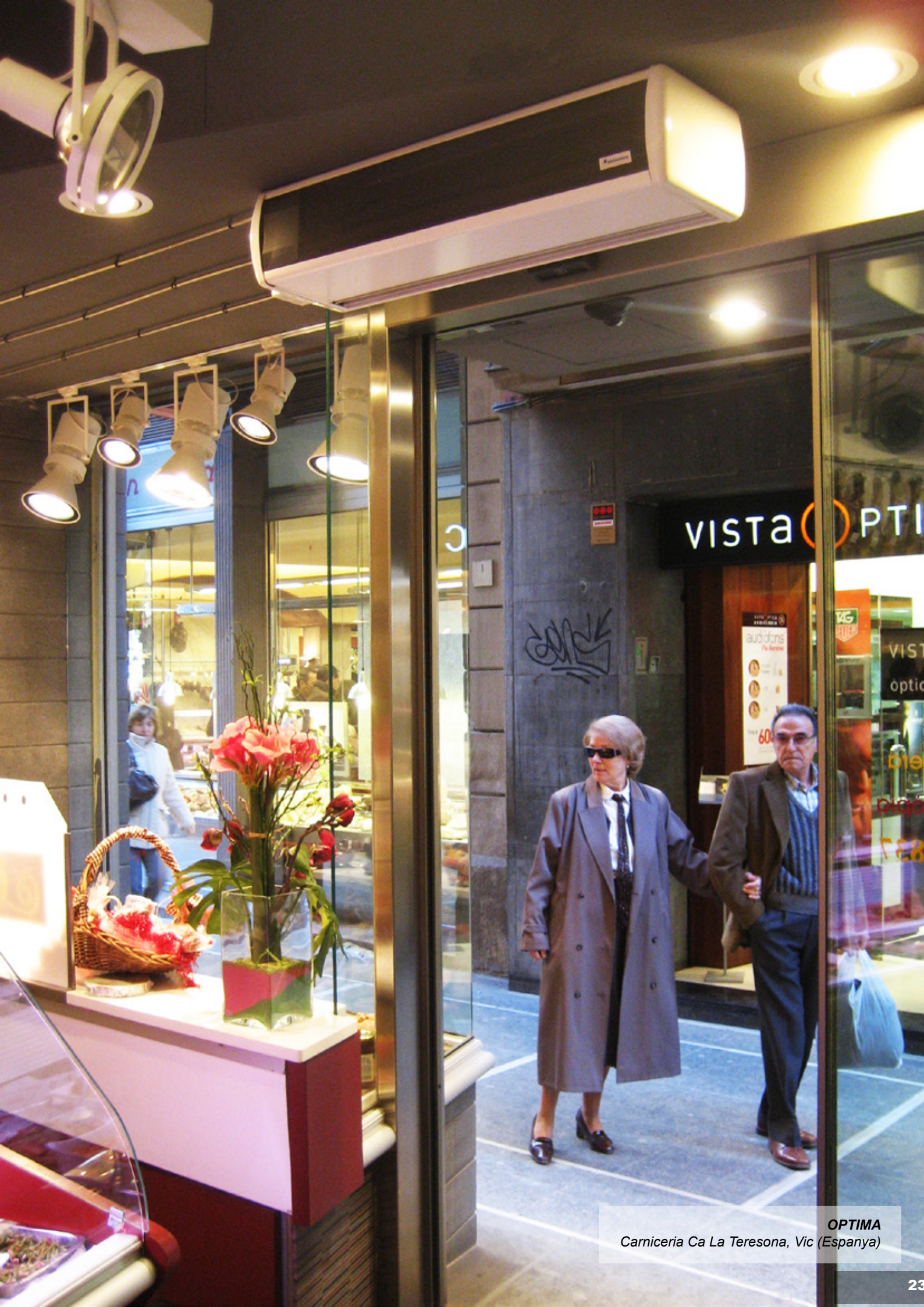
OPTIMA Carniceria Ca La Teresona, Vic (Espanya)