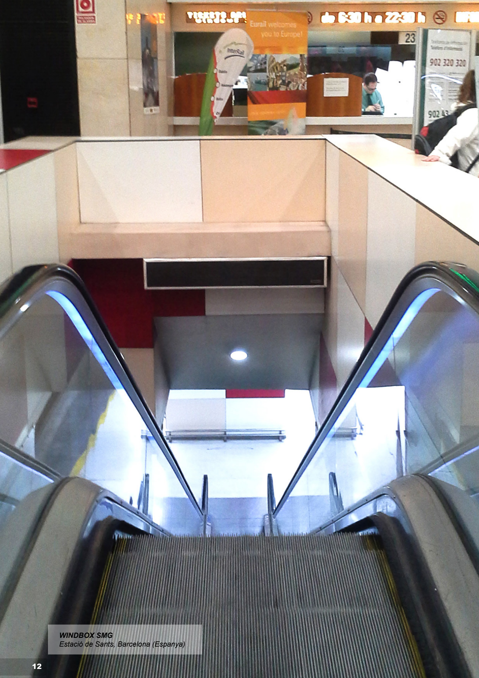
WINDBOX SMG Estació de Sants, Barcelona (Espanya)