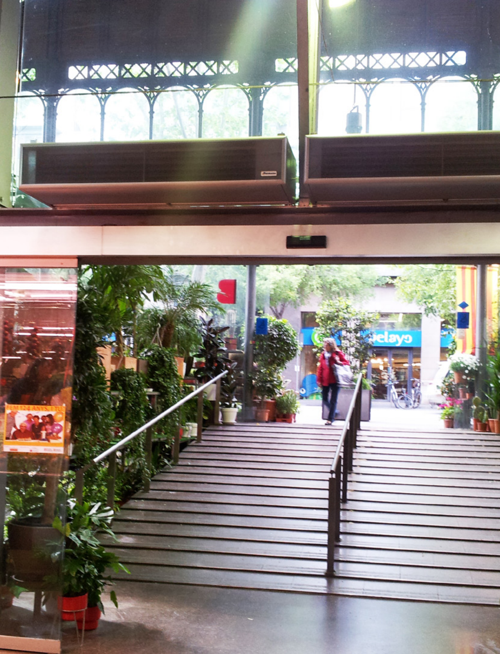
WINDBOX SMG, instal·lació múltiple Mercat de la Concepció, Barcelona (Espanya)