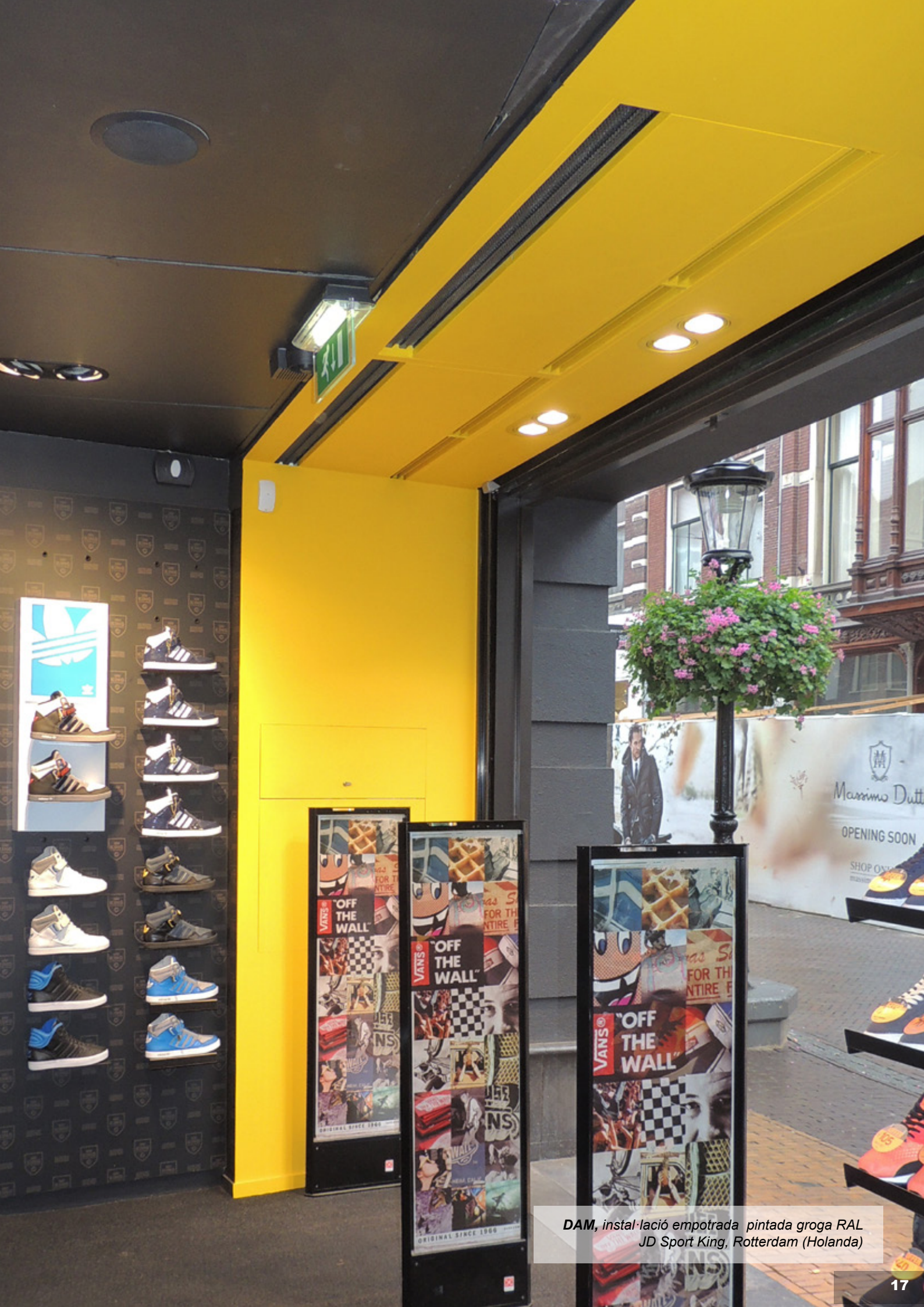
DAM, instal·lació empotrada pintada groga RAL JD Sport King, Rotterdam (Holanda)