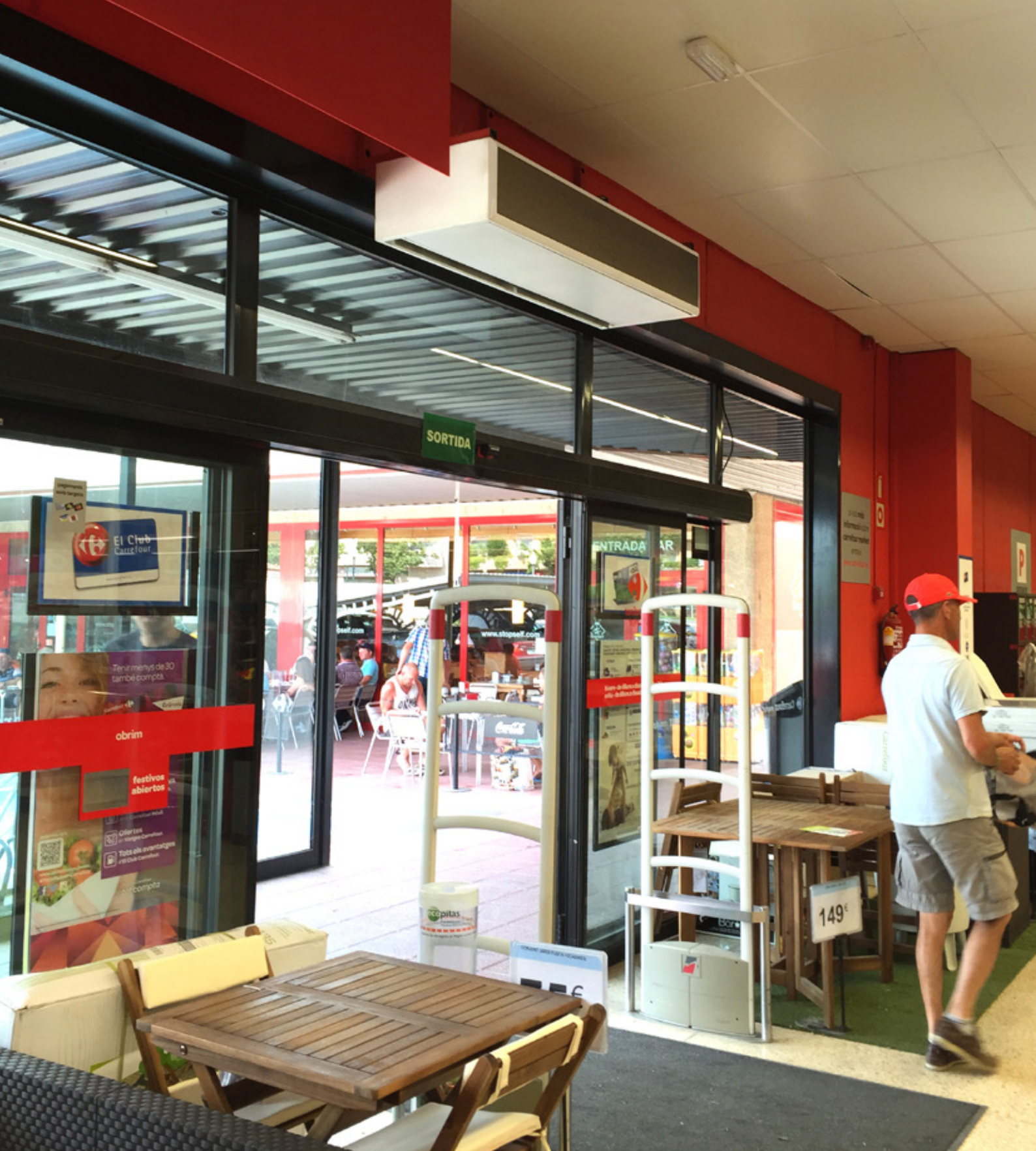
WINDBOX SMG Supermercat CARREFOUR, L'Estartit (Espanya)