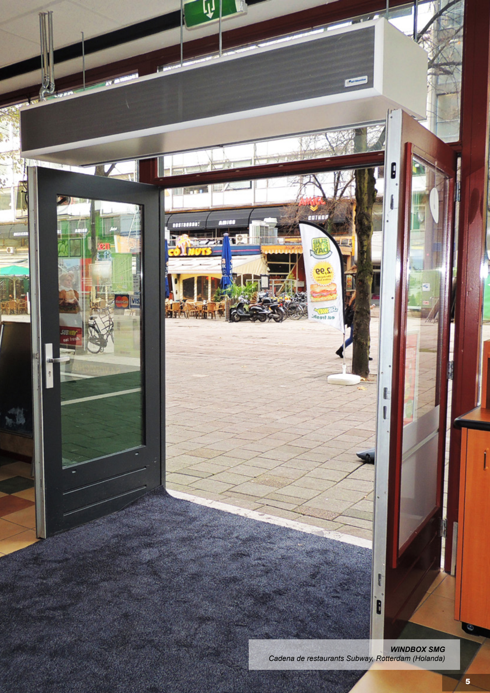
WINDBOX SMG Cadena de restaurants Subway, Rotterdam (Holanda)