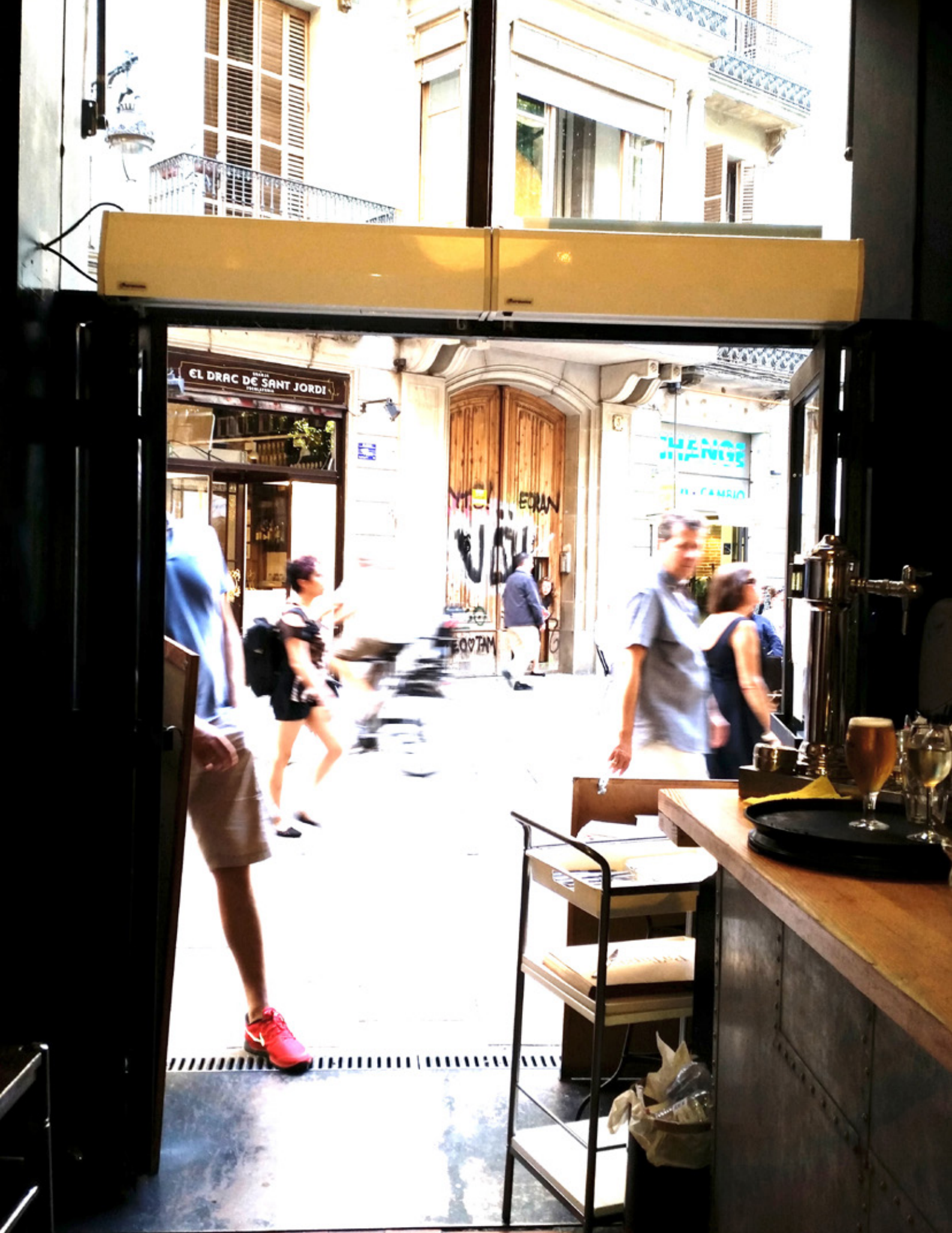
MINIBEL PaTapas, Barcelona (Espanya)