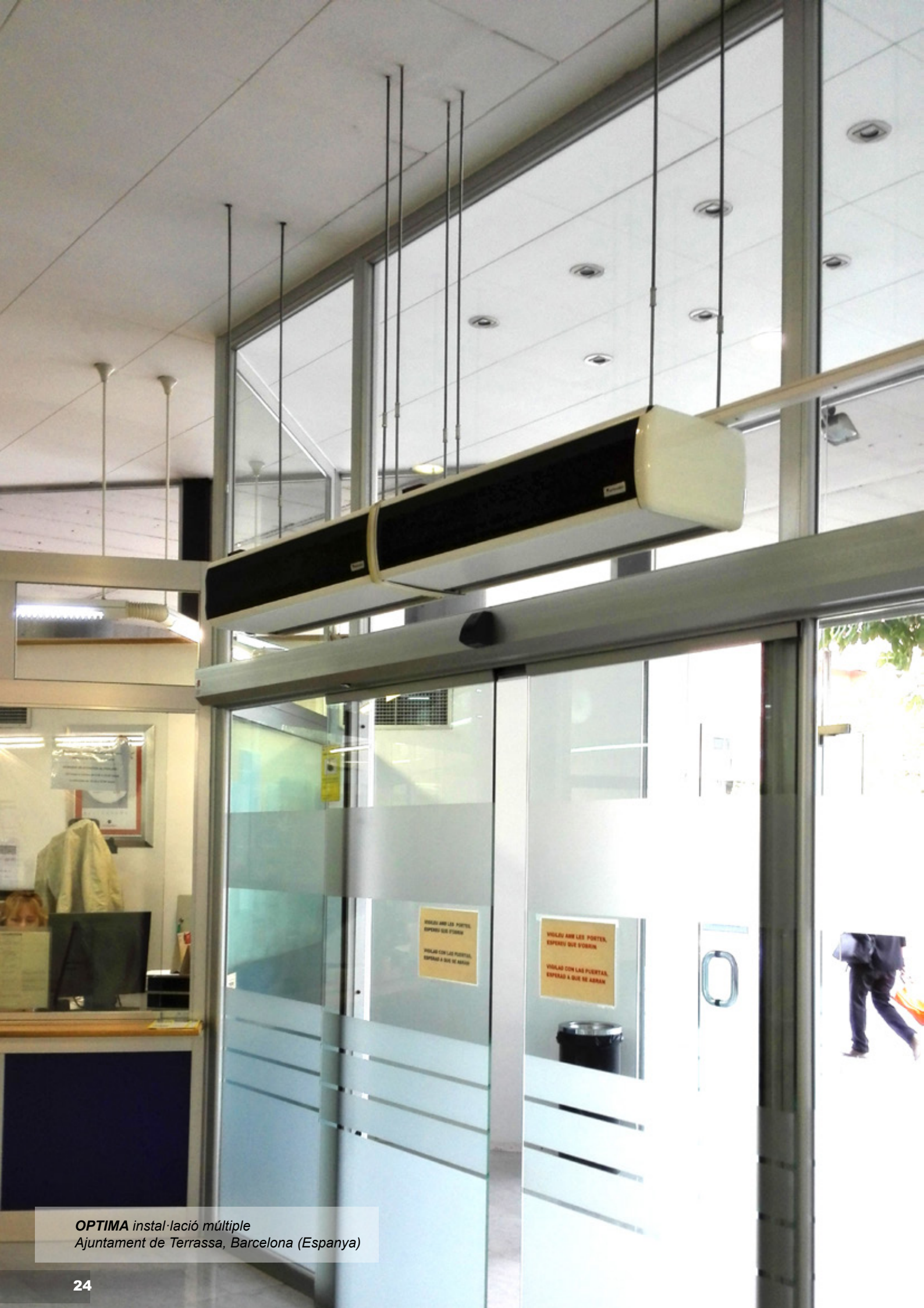
OPTIMA instal·lació múltiple Ajuntament de Terrassa, Barcelona (Espanya)