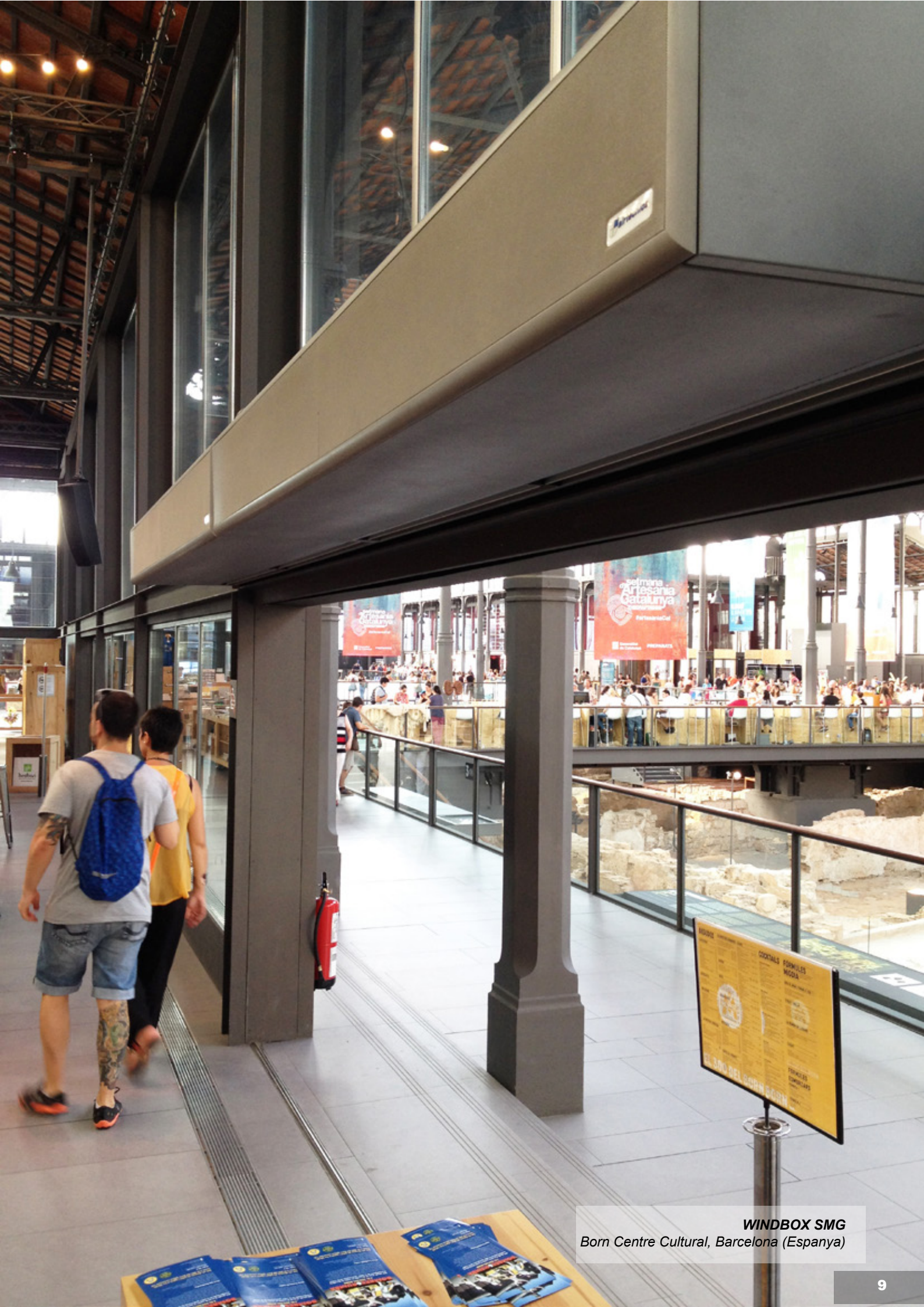
WINDBOX SMG Born Centre Cultural, Barcelona (Espanya)