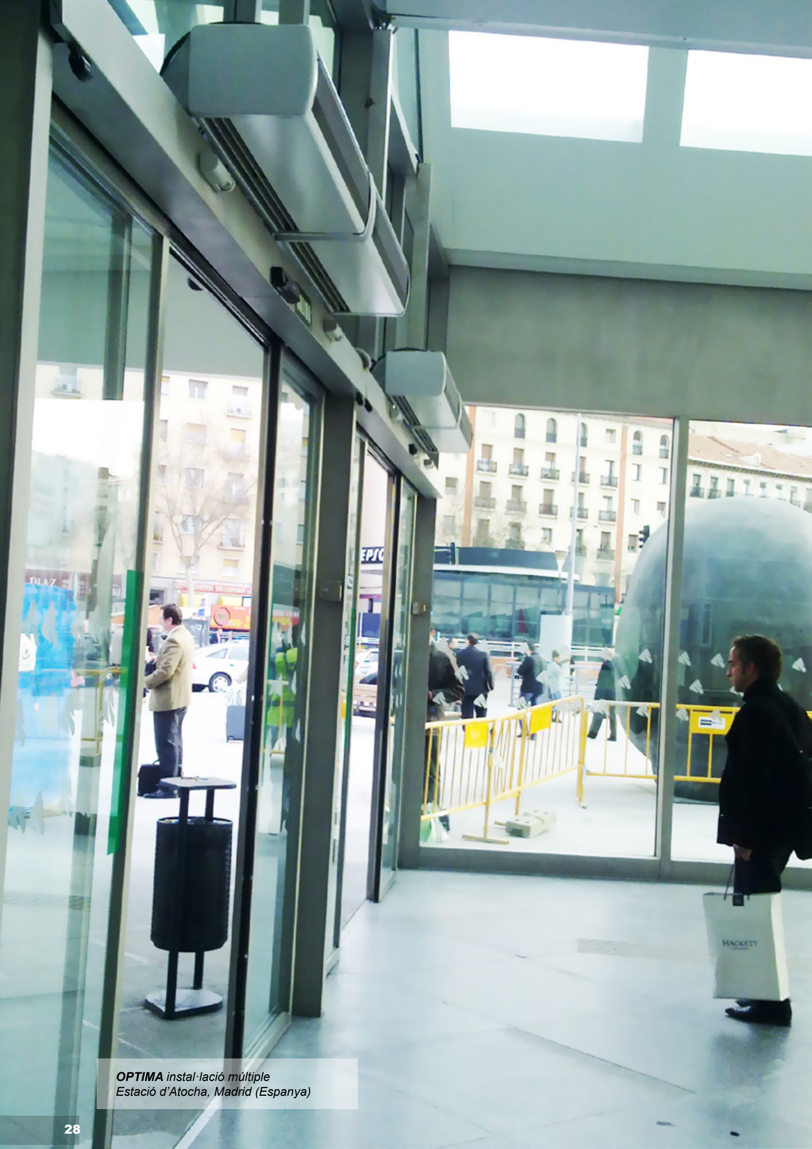
OPTIMA instal·lació múltiple Estació d'Atocha, Madrid (Espanya)