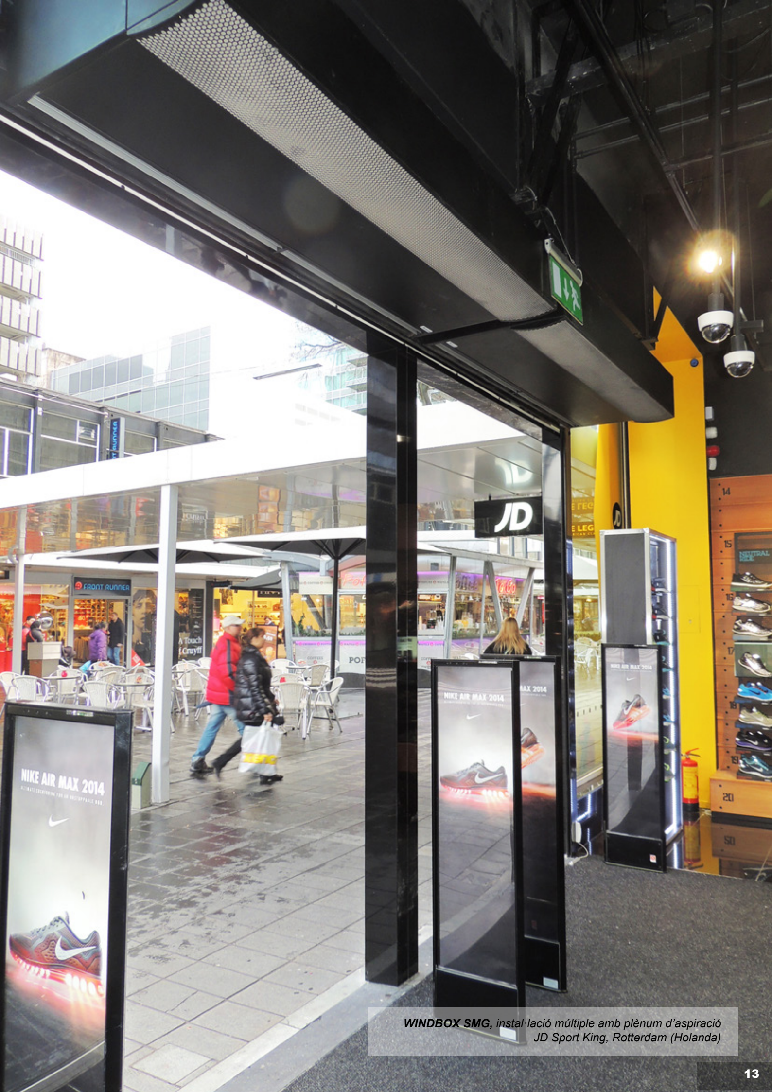
WINDBOX SMG , instal·lació múltiple amb plènum d'aspiració JD Sport King, Rotterdam (Holanda)